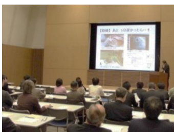
昨年度の発表会・展示交流会の様子